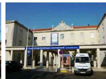
Hospital Dona Estefânia