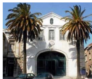
Hospital Santo António dos Capuchos