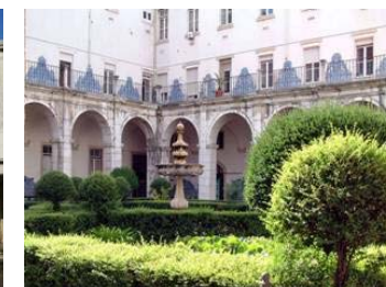
Hospital Santa Marta

CENTRO DE REFERÊNCIA DAS DOENÇAS HEREDITÁRIAS DO METABOLISMO crdhm@chlc.min-saude.pt