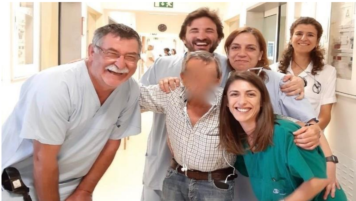
Equipa da UUM do CHULC com vítima de politrauma grave (rosto desfocado), com contusão pulmonar, após recuperação com recurso a ECMO

Desde 2014, o recurso a Extra Corporeal Membrane Oxygenation (ECMO) no Centro Hospitalar Universitário de Lisboa Central (CHULC) permitiu recuperar 69 por cento dos doentes admitidos. Sem esta técnica, a sobrevivência seria muito baixa ou nula e nos raros sobreviventes haveria uma morbilidade elevada. Saiba mais