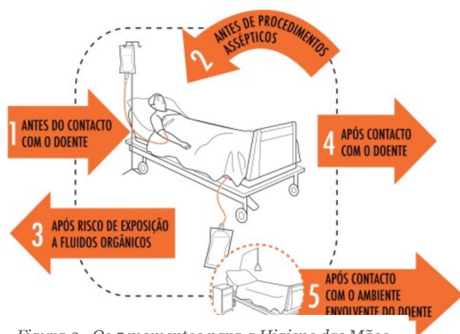
Figura 2 - Os 5 momentos para a Higiene das Mãos