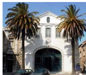
Hospital Santo António dos Capuchos