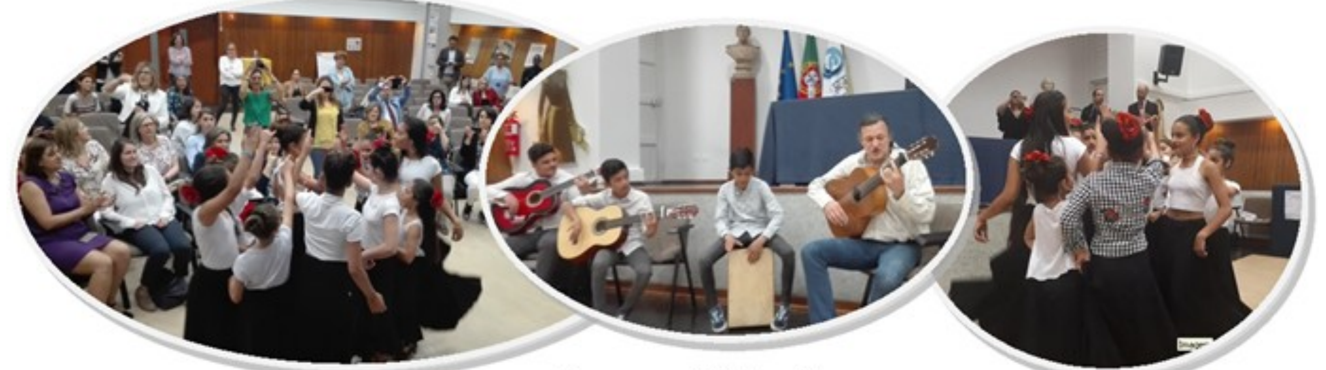
Danças e Violas Ciganas